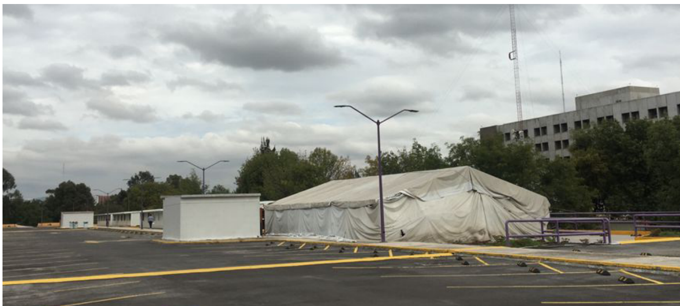
Segundo piso del Estacionamiento.