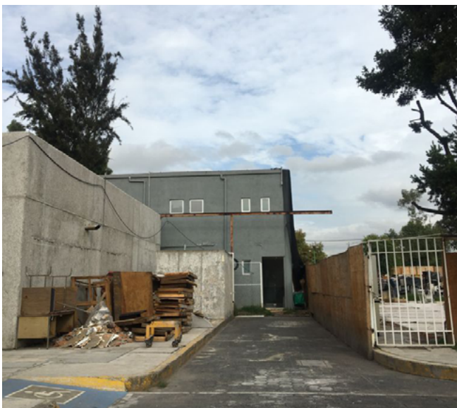
Tapial Edificio E 1

Cabe mencionar, que todo el equipo especializado que no se logró colocar en un área adecuada, fue empleado y resguardado de forma inadecuada en el cuarto de máquinas del Hospital, donde hay fugas, no hay servicio de limpieza y recientemente se ha convertido en un almacén. En esta área también están en funcionamiento algunos refrigeradores, congeladores y ultracongeladores, donde se resguardan muestras biológicas y reactivos. Equipo especializado que le costó al Hospital, pero sobre todo a los investigadores, quienes lograron obtenerlo con financiamiento derivado de convocatorias externas. Dicho equipo, después de varios años es estas circunstancias,