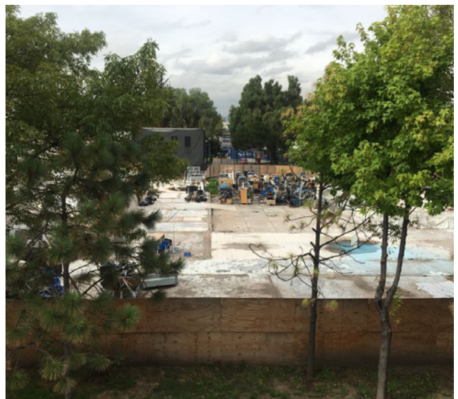
Junio 2021 Edificio E

La respuesta de las autoridades fue que no era factible habilitar instalaciones que pudieran funcionar como laboratorio en el Hospital, incluso en forma temporal. Sin embargo, en el área prefabricada se tendría un cubículo que serviría como oficina y centro de operaciones cuando fuera necesario, donde habría escritorios, nodos de internet y teléfonos. Esta área existe, es un espacio de 6 metros cuadrados donde pueden hacer trabajo de escritorio un máximo de 5 personas, que cuenta con conexión a internet, pero no cuenta con ningún otro servicio.