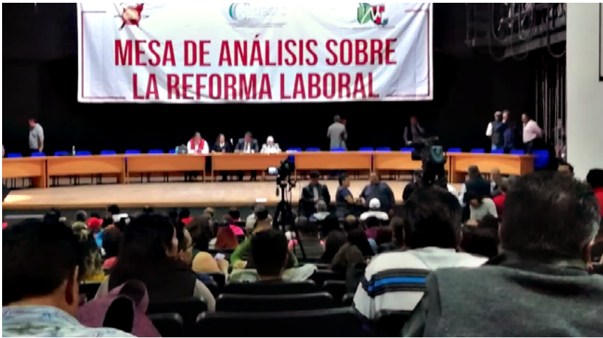
Auditorio del sindicato Mexicano de electricistas, 22 de octubre del 2019.

Dentro de los motivos que han impedido que investigadoras, investigadores y ayudantes de investigación en ciencias médicas formemos un gremio para la defensa de nuestros derechos laborales, se encuentran el miedo y desconocimiento de las leyes.