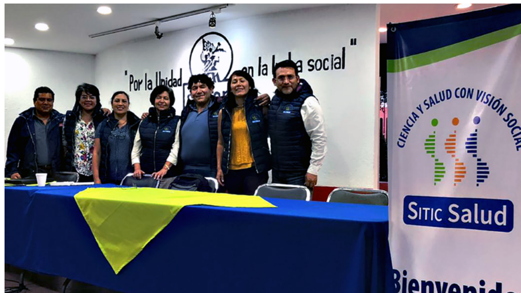
Consejo Directivo en las instalaciones del Sindicato Independiente de Trabajadores de la Universidad Autónoma Metropolitana (SITUAM)

No dejes de leer nuestros próximos boletines donde conocerás más de estas organizaciones.