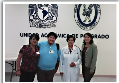
Visita a los institutos.